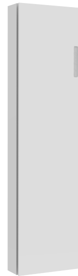
ClimaRad Ventura V1X